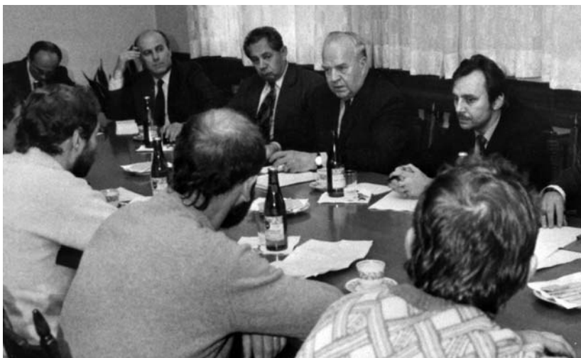
První jednání se zástupci opozice 21. listopadu 1989 při setkání Ladislava Adamce se zástupci pražské veřejnosti.