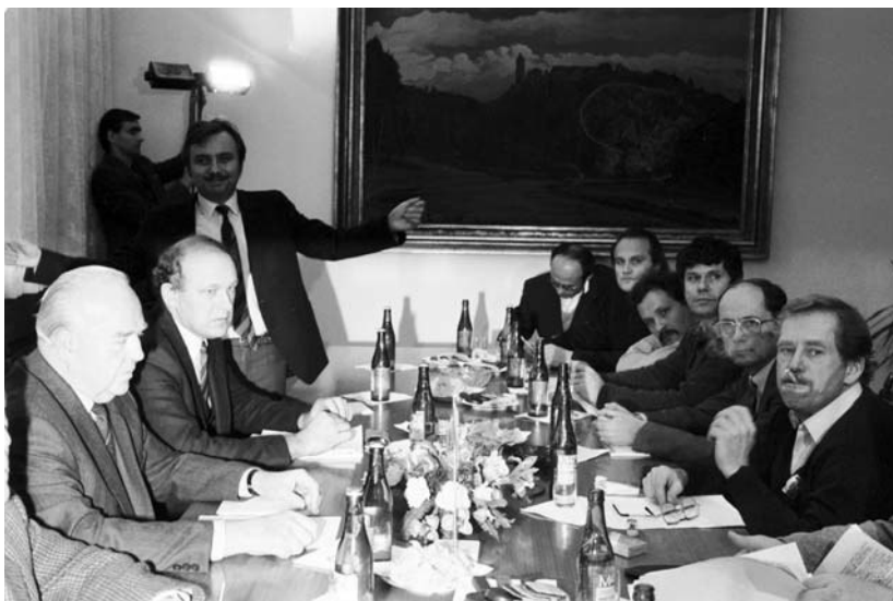
Setkání představitelů vlády 28. listopadu 1989

dva hlavní momenty. Spor se především vedl o pořadí, rychlost a patřičné legislativní zabezpečení požadavků tehdejší opozice – ne o jejich obsah. Rozepře nikdy nevznikla kolem otázky zrušení článků Ústavy, které zakotvovaly vedoucí roli komunistické strany – kromě Adamcova upozornění, že změny v Ústavě musí provést Federální shromáždění, nikoliv vláda. Druhým důležitým momentem bylo odmítnutí delegace Občanského fóra a Veřejnosti proti násilí předložit jmenovité návrhy lidí do vlády, ač je k tomu Adamec na žádost svého poradce několikrát vyzval.