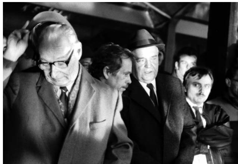
Tribuna Letenské pláně 26. listopadu 1989

Druhým velkým taktickým pochybením bylo – mírně řečeno – nedostatečné zdůvodnění vlády 15 : 5., vytvořené 3. prosince. Nejzávažnější taktickou chybou však byl odlet Adamce