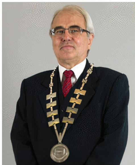
zdroj: Bibliografie dějin Českých zemí

Zdá se vám to nepřehledné a zamotané? To není náhoda, takto nepřehledných a zamotaných pravidel a přijímaných usnesení mnoho. Podstata Evropské unie se nemění. Jen chce ještě více centralizace a dokonce chce sebrat státním práva veta, za podpory mimo jiné prezidenta a vlády ČR.